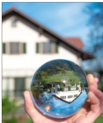
Die Welt steht kopf.