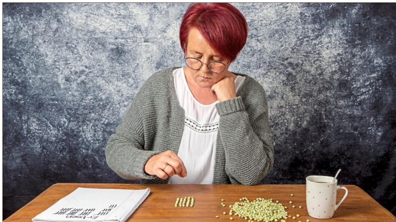
„Die Erbsenzählerin“ hat noch viel zu tun, bis die Krise überstanden ist.