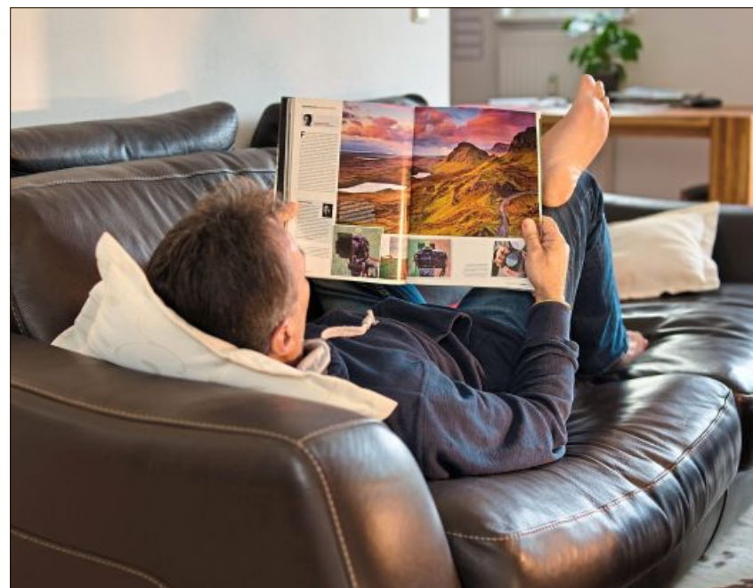
Für Fotografen gibt es immer etwas Neues zu entdecken.