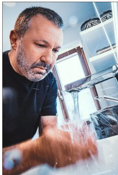
Hände waschen!