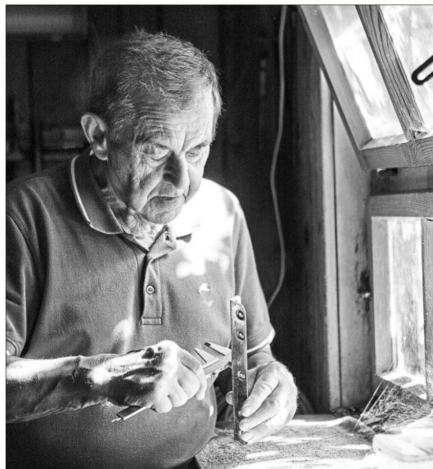
Endlich ist ausreichend Zeit, um in der Hobbywerkstatt zu basteln.