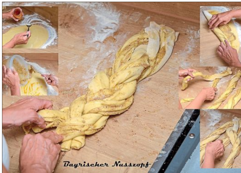
Bei Reiner Krämer gibt es einen leckeren bayerischen Nusszopf.