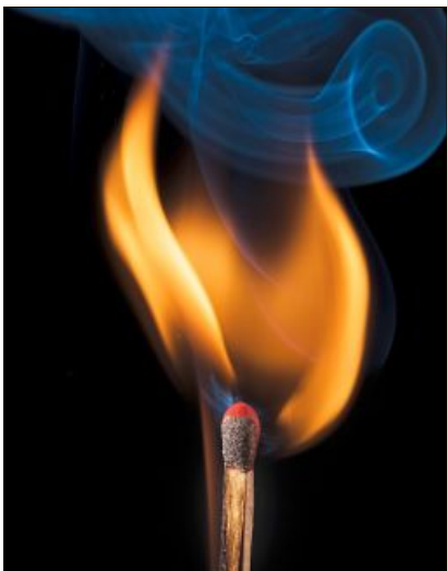
Spiel mit dem Feuer.