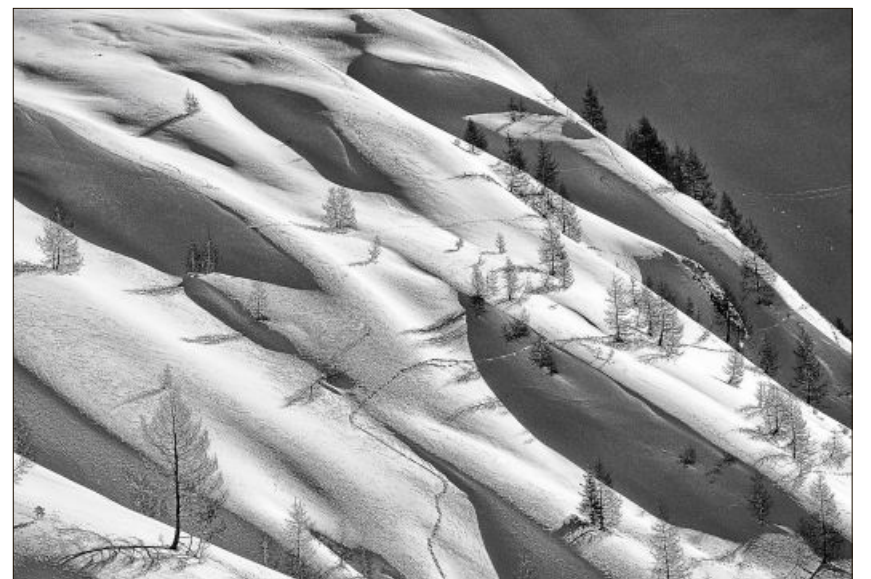
Wellen im Winter – ganz ohne Wasser.