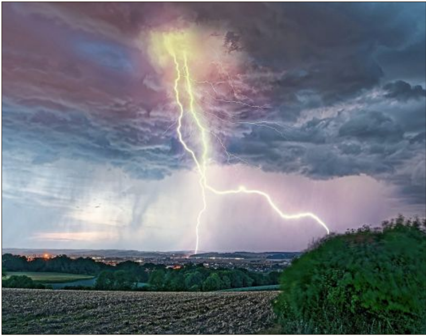
Die geballte Kraft der Natur entlädt sich im Blitz.