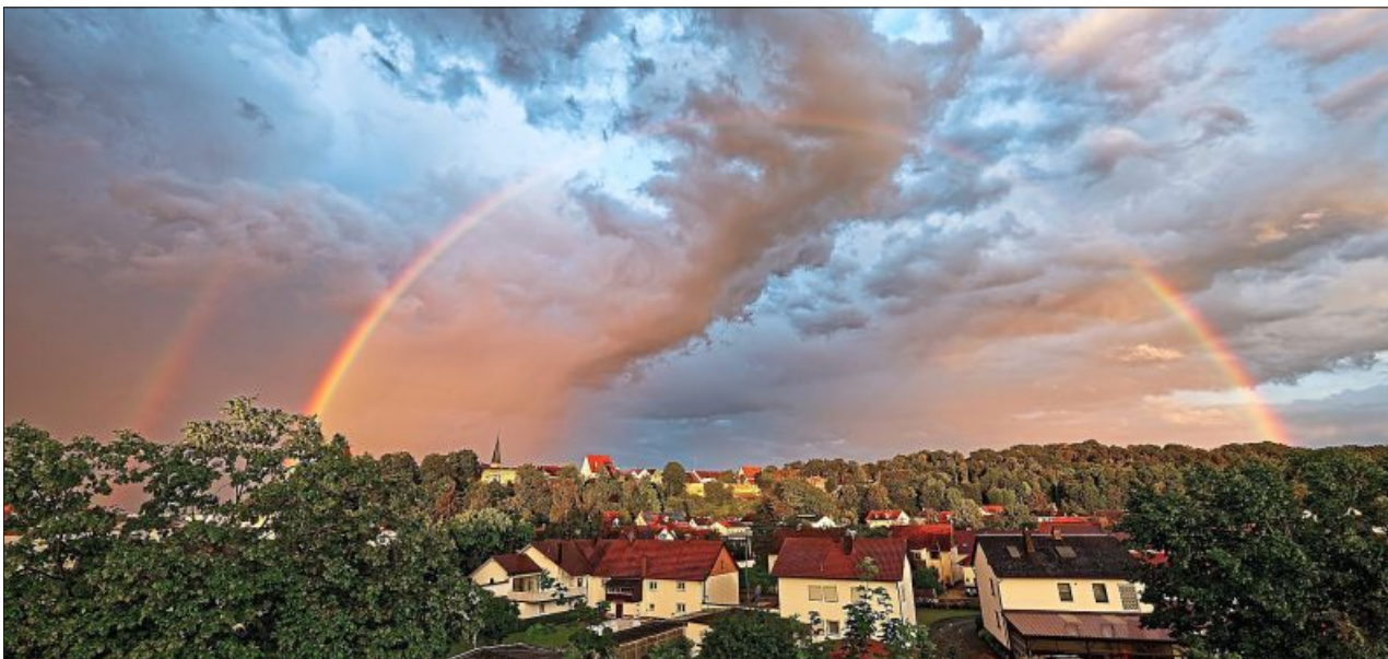
Ein Regenbogen erleuchtet den wolkenverhangenen Himmel.

Wer von den Bildern der Fotofreunde nicht genug bekommt, muss übrigens nicht lange warten, denn das Thema für die nächste Woche steht bereits in den Startlöchern. Ein kleiner Tipp sei erlaubt: Einige Fotofreunde konnte man in letzter Zeit wohl bei dem ein oder anderen Spaziergang durch heimische Wälder beobachten. Auf die Ergebnisse darf man gespannt sein!