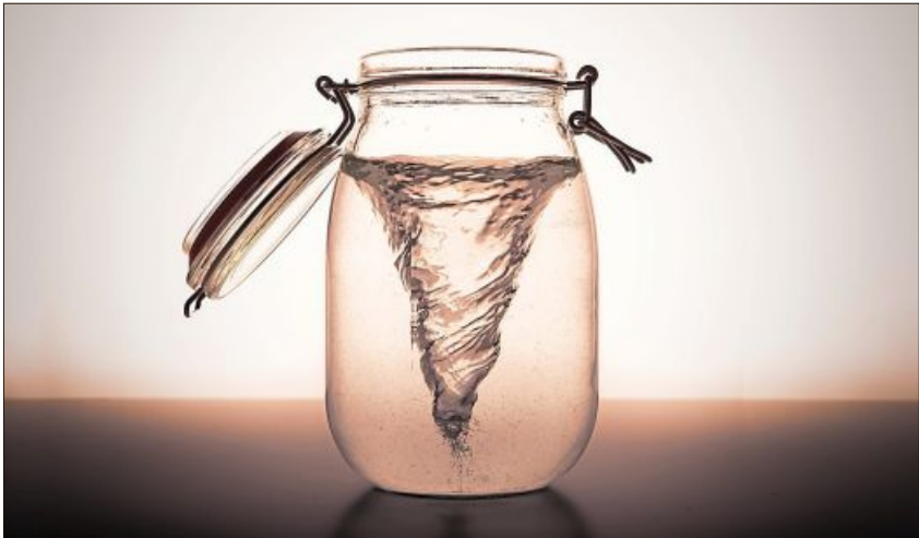
Der Sturm im Wasserglas.