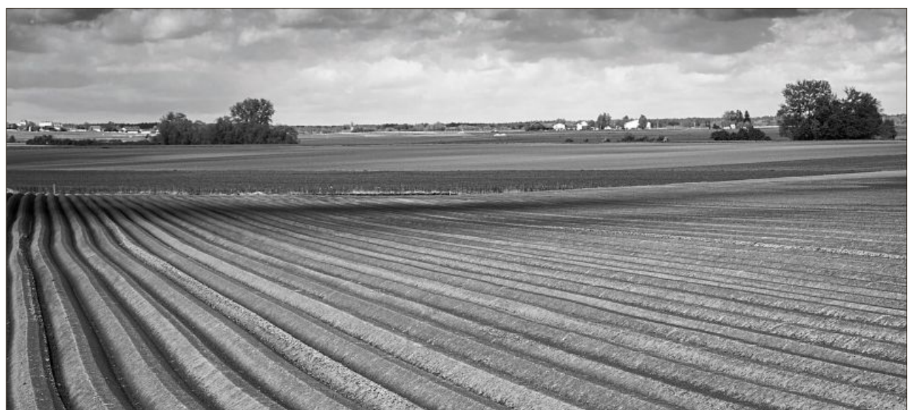
Still und weitläufig zeigt sich Mutter Erde in diesem Bild.