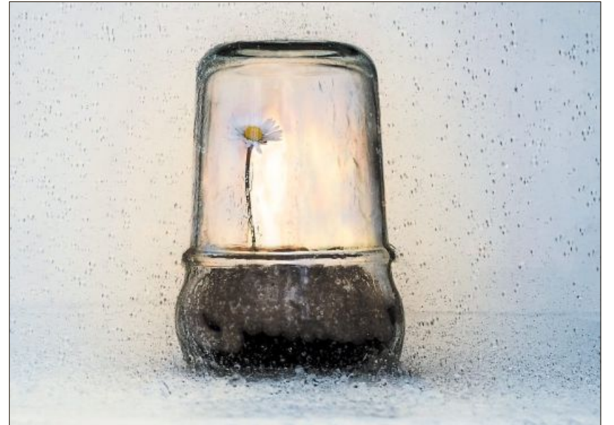
Vereint: Wasser, Feuer, Erde, Luft.