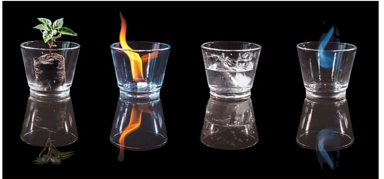
Unter dem Titel „Alles, was man zum Leben braucht“ hält Wolfgang Amann die vier Elemente bildlich fest.