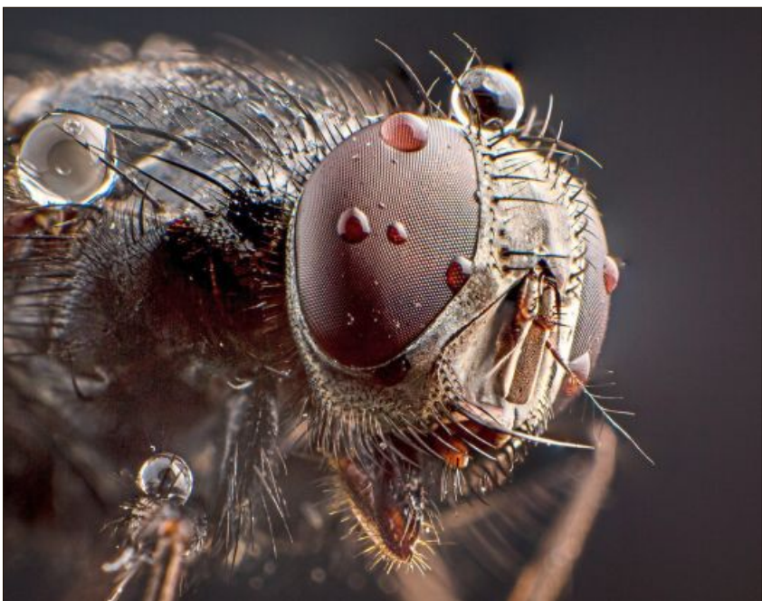
Die Nahaufnahme einer Fliege – ein faszinierender Anblick.