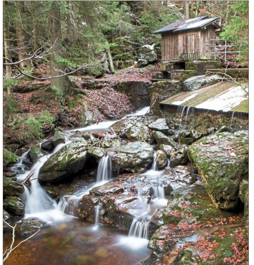
Die Rißloch-Wasserfälle im Bayerischen Wald.

Eine gute Nachricht gibt es für alle, die von den Bildern der Fotofreunde nicht genug bekommen können: Die Ausstellung in der Heimatzeitung, die eigentlich nach den nächsten zwei Fotoseiten beendet worden wäre, wurde nun doch um einige zusätzliche und in der Umsetzung spannende Themenblöcke erweitert. Man darf gespannt sein, was sich die Fotofreunde Dingolfing noch so einfallen lassen.