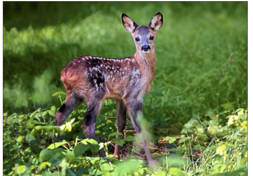
Ein kleines Rehkitz auf Erkundungstour durch den Wald.