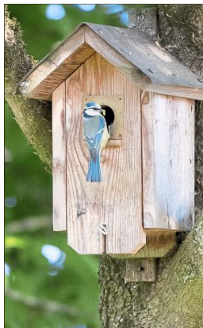
Essen ist fertig!