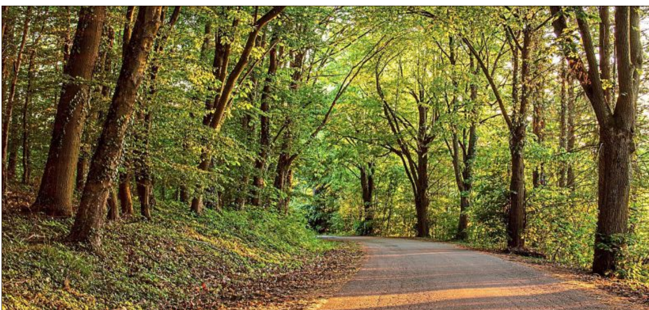
Sonnenstrahlen kämpfen sich durch die dicht stehenden Bäume.