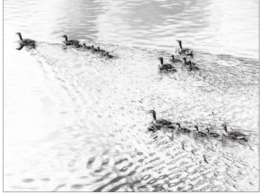
Ein Familienausflug auf der Isar bei Gottfrieding.