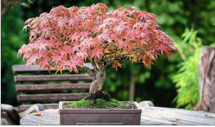
Ein farbenfroher Wald im eigenen Garten.