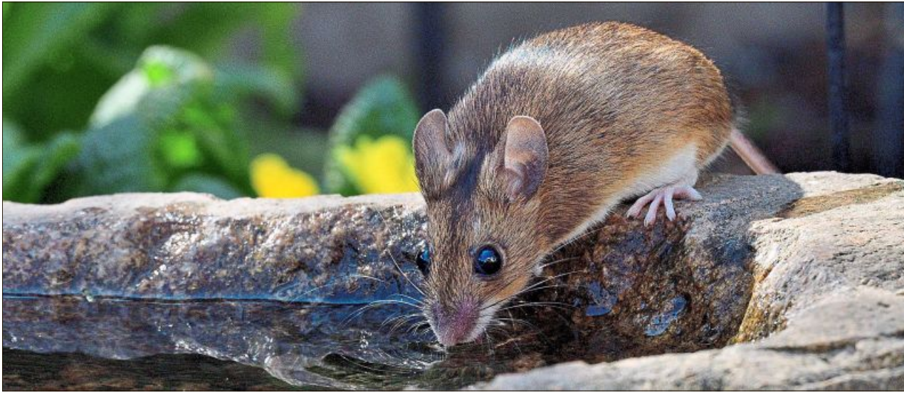
Sepp Harpaintner bekam eine Maus beim Trinken vor die Linse.