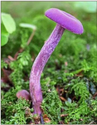
Der violette Lacktrichterling.