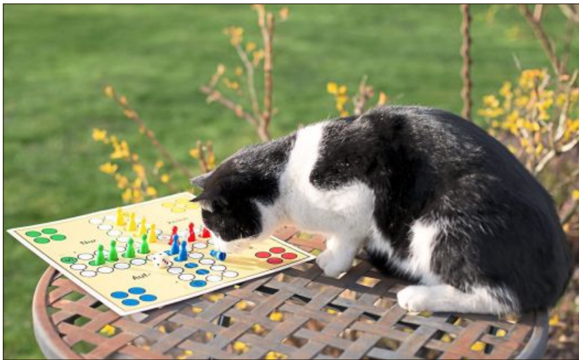
„Olle dahoam“ zum Spielen von Peter Dausend.