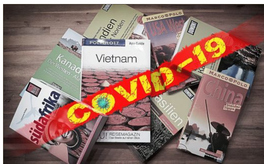
„Covid-19“ von Albin Hirschberger – das Reisen ist erst einmal nicht möglich.