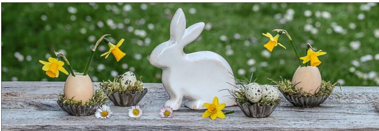
„Ostern 2020 dahoam“ von Carmen Seidl.