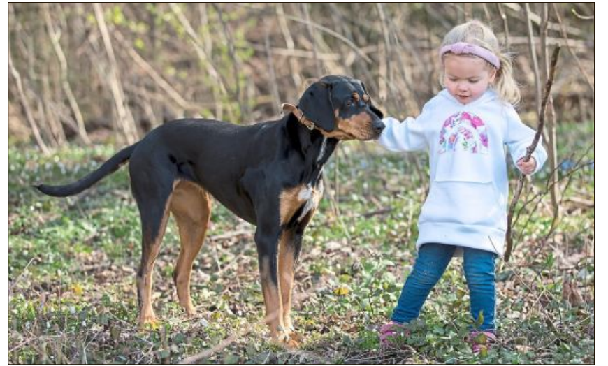
„Freunde“ auf Entdeckungstour von Anita Engel-Schober.