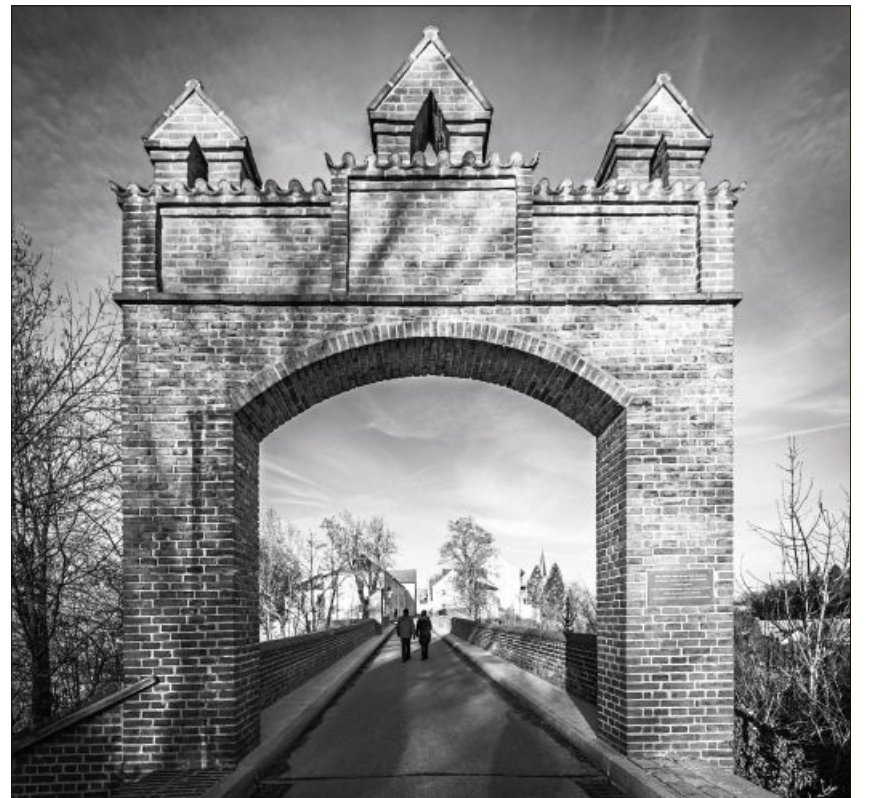
„Ausgangsbeschränkung“ lautet der Titel zum Werk von Albin Davidenko.

Dazu werden in naher Zukunft in mehreren Blocks immer wieder Aufnahmen zu einem bestimmten Thema erarbeitet und präsentiert. Passend zur aktuellen Lage und zur Ausgangsbeschränkung steht der erste Bilderreigen unter dem Motto „Wir bleiben Dahoam“. Die Künstler verzaubern mit ihren ganz individuellen Sichtweisen, Blickwinkeln und Ansichten.